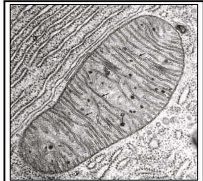
(أ) صورة إلكتروغرافية للميتوكوندري