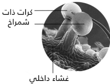
(ج) صورة بالمجهر الإلكتروني الكاسح للكرات ذات شمراخ على مستوى الغشاء الداخلي للميتوكوندري