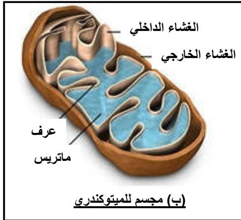
(ب) مجسم للميتوكوندري