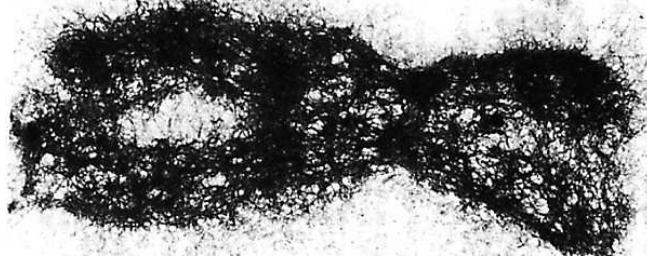
لاحظ بنية الصبغي الاستوائي.

الصبغة الصبغية: تعبر عن عدد الصبغيات وهي ميزة نوعية قد يرمز لها ب 2n أو ب n (أحادية أو ثنائية). الهستون: مكون من مكونات الخييطات النووية وهو عبارة عن بروتين يرتبط به خييط ADN ليعطي مظهر عقد اللؤلؤ للخييط.